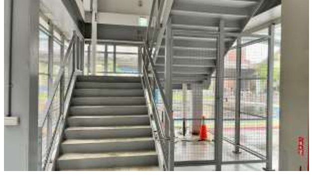
④樓梯至一樓往活動中心