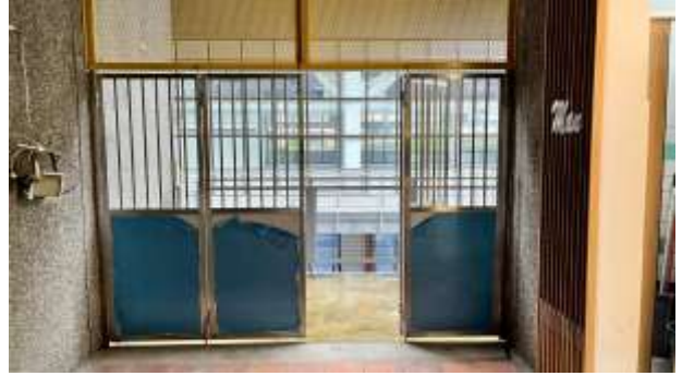
②2樓往活動中心行徑路線