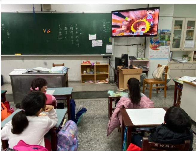
說明:防治數位性暴力