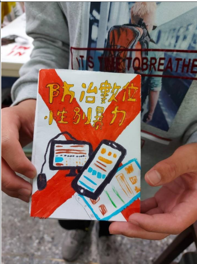
說明:性平小書製作