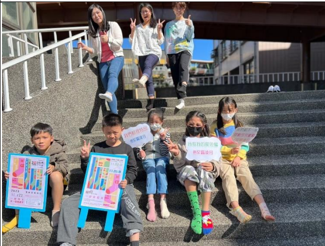
說明:襪！我們不一樣