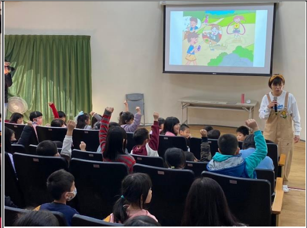
說明:健康上網說故事