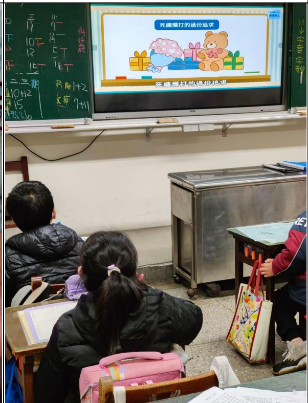
說明:性侵害防治宣導